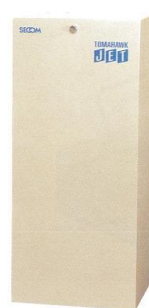
●3LR-1, 2/3LF/6.5D用 (W)270%×(H)700%×(D)200%